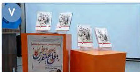
۷ کتاب پرستار بیمارستان فاو در دانشگاه بیرجند رونمایی شد