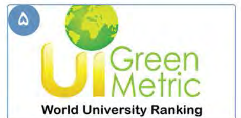
۵ برای سومین سال متوالی؛ قرارگیری نام دانشگاه بیرجند در میان «دانشگاه های سبز» جهان