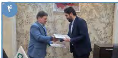
۴ تفاهم نامه همکاری بین دانشگاه بیرجند و بنیاد برکت منعقد شد