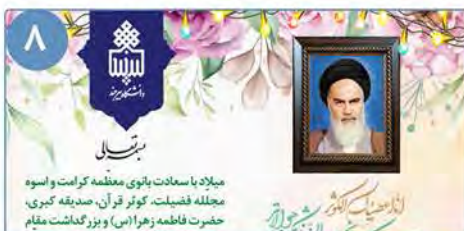
۸ پیام تبریک رئیس دانشگاه بیرجند به مناسبت میلاد با سعادت حضرت فاطمه زهراء (س) و بزرگداشت مقام زن و مقام شامخ مادر