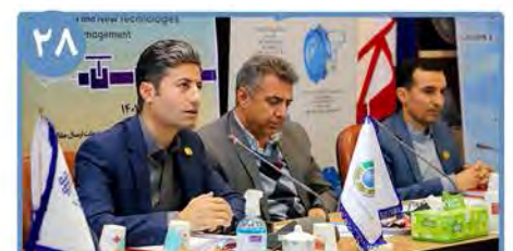
۲۸ اولین همایش بین المللی و دومین همایش ملی مدل سازی و فناوری های جدید در مدیریت آب در دانشگاه بیرجند برگزار می شود