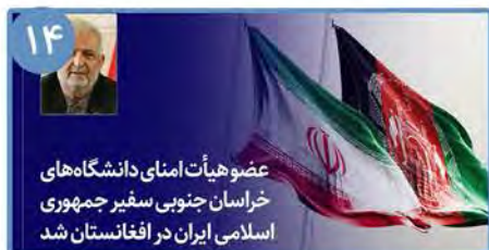
۱۴ عضو هیأت امنای دانشگاه های خراسان جنوبی سفیر جمهوری اسلامی ایران در افغانستان شد