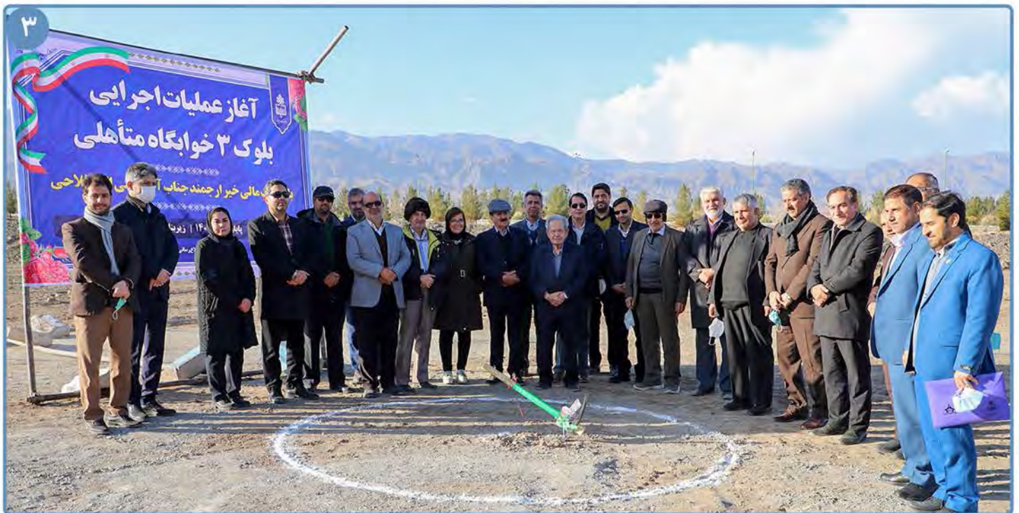
به همت خیرین و حامیان دانشگاه بیرجند انجام شد؛ آغاز عملیات اجرایی سه پروژه عمرانی در دانشگاه بیرجند